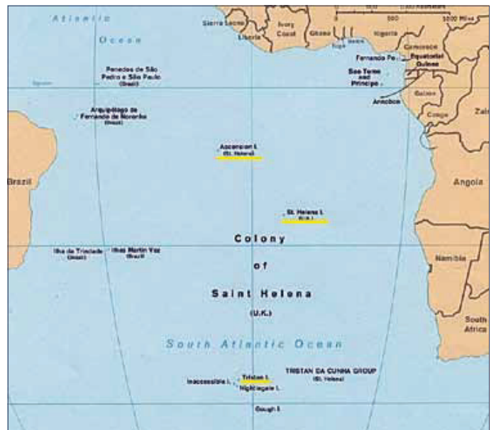
Abb. 3: St. Helena mit Ascension und Tristan da Cunha

Auf der anderen Seite der Erde wurden durch einen Beschluss des Wiener Kongresses (1814/1815) die karibischen Inseln Saint Lucia (1814) sowie Trinidad und Tobago (1815) dem Königreich Großbritannien zugesprochen. Und im Atlantischen Ozean besetzen die Briten 1816 die Inseln Ascension