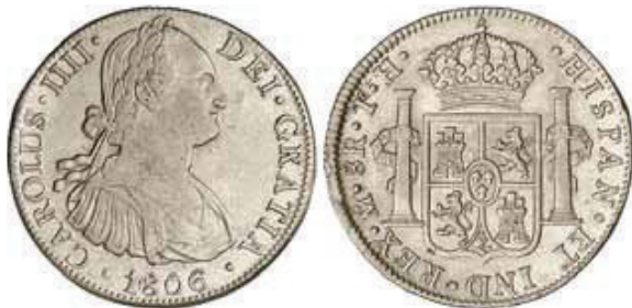
Abb. 4: Mexiko, 8 Reales 1806 (Spanischer Dollar), König Karl IV. von Spanien

Als Rückmeldung gab es den Wunsch, neues Kolonialgeld solle an den (spanischen) Dollar ( Abb. 4 ) angelehnt sein, da dieser weltweit zirkulierte und überall akzeptiert wurde. Ferner sollte das Geld kein gesetzliches Zahlungsmittel im Mutterland Großbritannien sein, damit es möglichst an Ort und Stelle in den Kolonien verbleibt und nicht nach England abfließt.