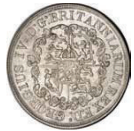
Abb. 6: Vorderseite der Anker-Dollar-Münzen (1820-1822)

Umgeben ist der Anker von der Umschrift: COLONIAR: BRITAN: MONET: und je nach Münznominal jeweils zweimal