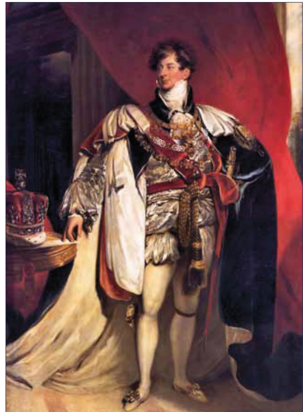
Abb. 5: König Georg IV. von Großbritannien, gemalt von Sir Thomas Lawrence, 1816

Die Inschrift für die neuen Münzen sollte auf dem Revers lauten: COLONIAR: BRITAN: MONET: (= Coloniarium Britannicarum Moneta; lateinisch für „Britisches Kolonialgeld“) und auf dem Avers: GEORGIUS III D:G: BRITANNIARUM